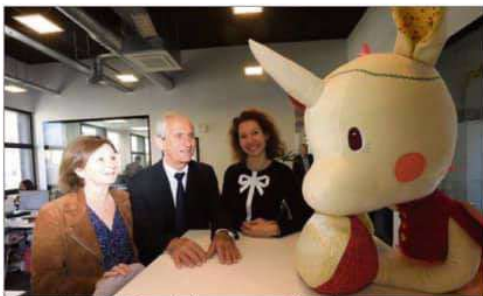
La licorne est le symbole de Berceau Magique, success story toulonnaise !

« Imaginez un peu : Berceau Magique atteint 6 millions de personnes via Internet et, tout ça, depuis Toulon ! Grâce au numérique, tout est désormais possible. Là où il faut des générations pour rechercher autant de gens, aujourd'hui, tout est accéléré et vous avez en prendre le main des nouvelles technologies en marche », a-t-il ajouté. Nouvelles technologies : le mot est lâché et un autre le supplante : intelligence artificielle. C'est dans cette matière que l'entreprise Cartesian s'est spécialisée.